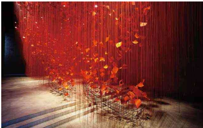
上 Top: 《掌の鍵》The Key in the Hand, 2015 インスタレーション:古い鍵、ヴェネチアの木製の船、赤い毛糸 Installation: old keys, wooden boats, red wool 第56回ヴェネチア・ビエンナーレ国際美術展、ヴェネチア、イタリア Japan Pavilion at 56th Venice Biennale, Venice, Italy 写真: サニー・マン Photo by Sunhi Mang ©JASPAR, Tokyo, 2022 and Chiharu Shiota 下 Bottom: 《I hope...》2021 インスタレーション:ロープ、紙、鉄 Installation: rope, paper, steel Courtesy of K11 Art Collection 写真: サニー・マン Photo by Sunhi Mang ©JASPAR, Tokyo, 2022 and Chiharu Shiota